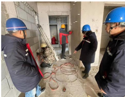
表 扬 信