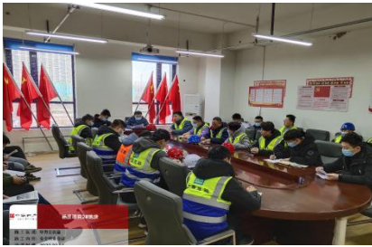
中海杨庄项目安全检查会议