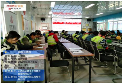
中海丽华北项目监理例会

人勤春来早。春节假期刚过，中海丽华北、杨庄、北寒，远大、旭辉、森海湾、晋城百灵街西延等项目已陆续开工，各个项目部全体人员在总监带领下，以饱满的工作热情，投入到紧张、有序的监理工作中。