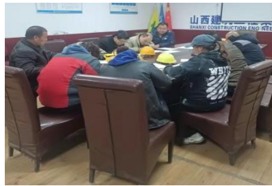
森海湾三期项目监理会