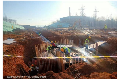
晋城百灵街西延道路工程节后复工