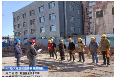
远大安置房项目节后复工安全交底