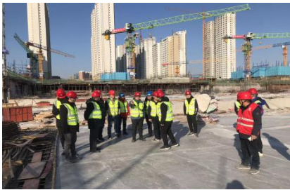
北寒 B1 项目复工安全巡检