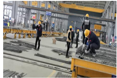
预制构件厂节后复工