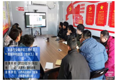
旭辉林语项目复工前准备会议