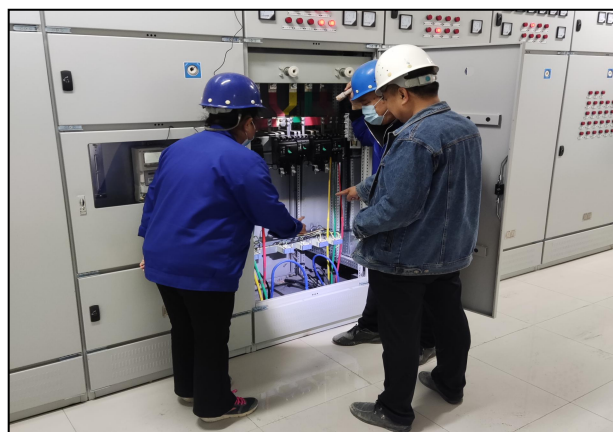
检查配电柜输出电缆电源压线