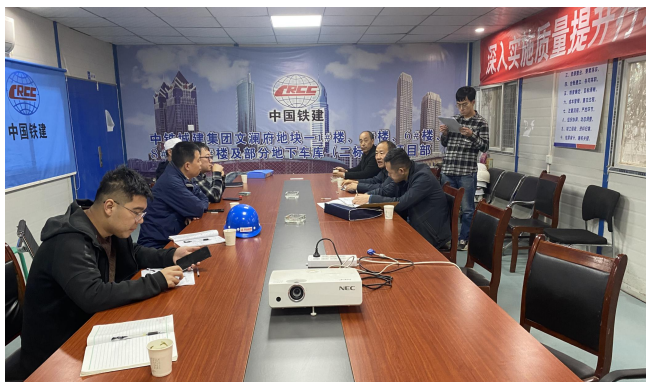
住建局检查阳光文澜府项目