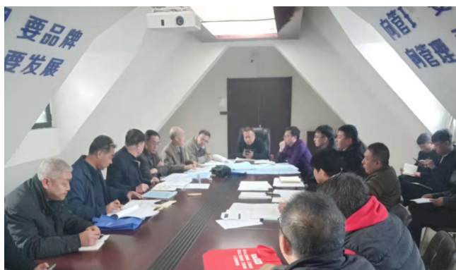
阳光揽胜南五期双液注浆专家论证