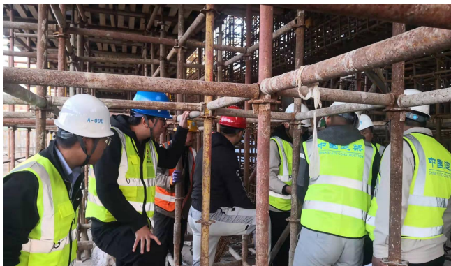
丽华北项目人防验收