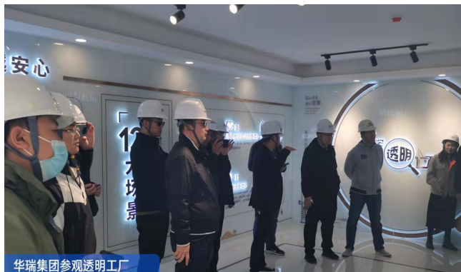
华润集团来参观旭辉江山透明工厂