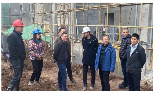
海尔地产学府项目第四季度集团巡检