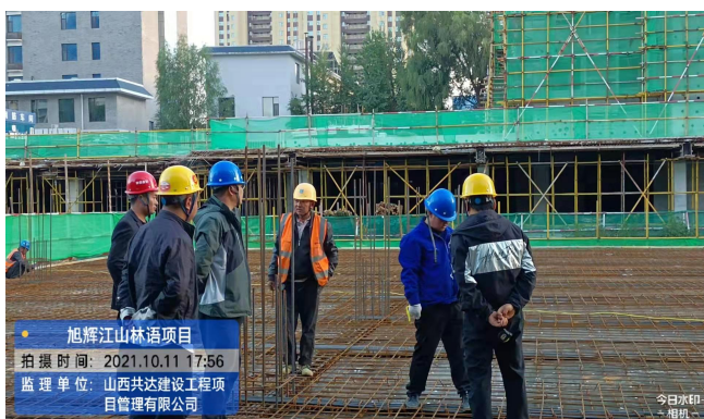
旭辉林语项目双层南地库负二层钢筋验收