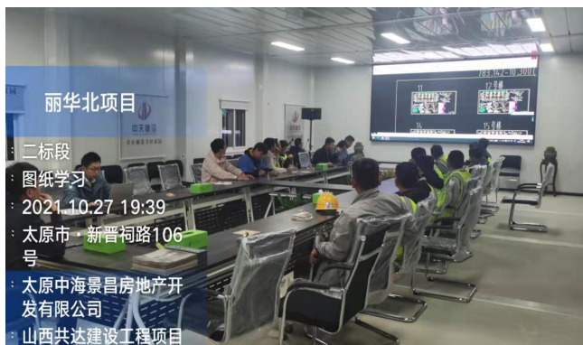
丽华北项目叠拼区域图纸学习