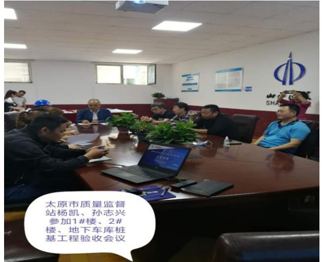
森海湾项目地库桩基工程验收会