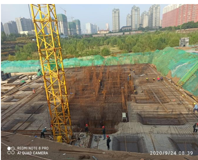
君睿府项目地库筏板施工现场