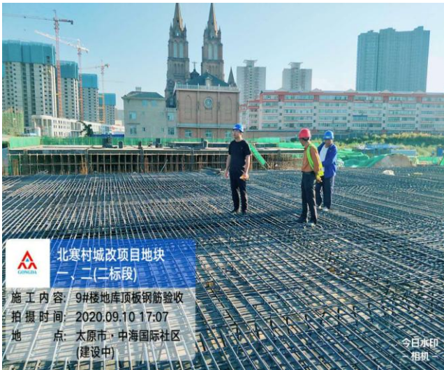
中海北寒 城改项目监理部 监理巡视