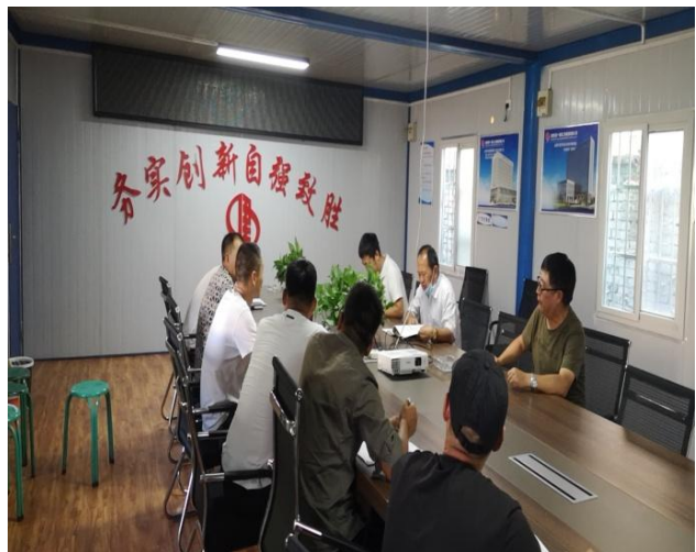
旭辉柴村双子楼项目监理例会