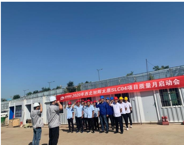
旭辉三给村(地块三)项目质量月启动会